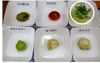
1月17日 大根と白菜に新しい芽が。