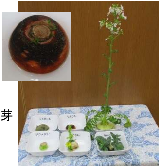
2月12日 にんじんに芽が出た。