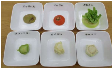
1月13日 実験スタート！

1月13日（月）から2月16日（日）まで、『やさいはいきている そだててみよう やさいのきれはし』（ひさかたチャイルド）で紹介されている、野菜の切れ端を栽培する実験を児童資料コーナーで行いました。じゃがいも、にんじん、大根、ブロッコリー、白菜、キャベツの6種類の野菜の切れ端を水と日光だけで育てた結果を報告します。