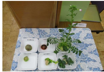
2月7日 ・大根に花が咲いたが、アブラムシが発生。 ・ブロッコリーとにんじんは芽が出てこない。