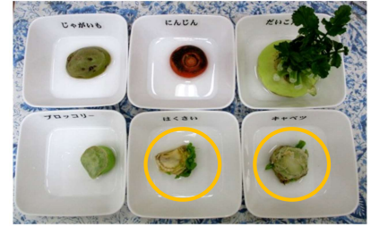
1月22日 ・すくすく育つ大根の葉っぱ。 ・白菜の葉とキャベツの芽も育ってきた。