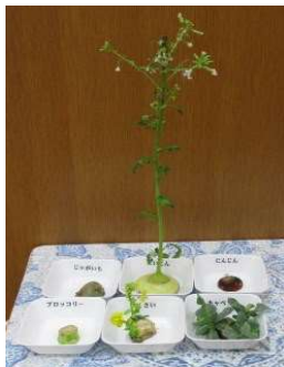
2月16日 実験最終日 ・大根の花はアブラムシに食べられて枯れた。 ・ブロッコリーだけは芽が出なかった。