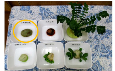
1月30日 ・じゃがいもの芽が出てきた。