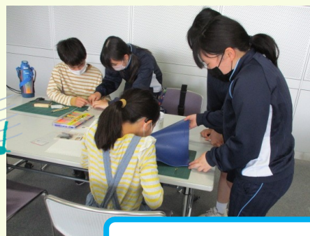
あなたもアーティスト！