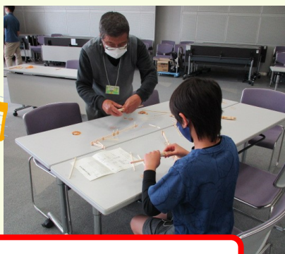
伝承手づくりおもちゃ