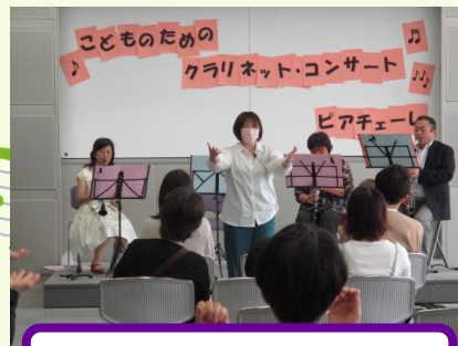
クラリネットコンサート