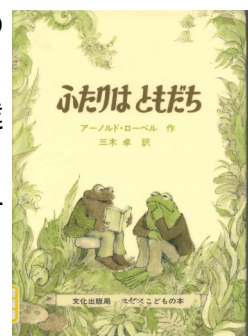
『ふたりはともだち』 アーノルド・ローベル／作 三木卓／訳 文化出版局

刺激的で展開の速いマンガや動画が大好きな息子ですが、こういう美しい日本語で書かれたおはなしを読んだ後の満足な様子や、親子でほっとする感じは、本当によいものです。（H）