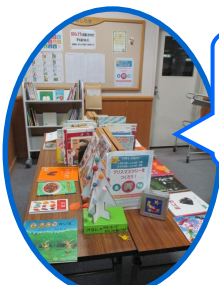
おすすめコーナー

本を選んでいるお家の方の姿が お子さんから見えやすい場所に 料理、手芸、病気、介護などの 本を集めています。