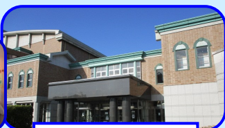
三木町文化交流プラザ