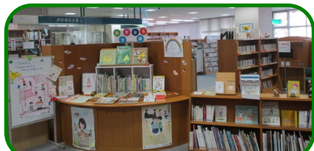
あすなる文庫（子育て応援コーナー）

あすなる文庫は、三木町と香川大学が共同で実施している、すべての親に子育てについて学ぶ機会を提供する「あすなるプロジェクト」の一環で設置されたコーナーです。