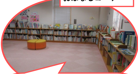
おはなしコーナー

閲覧室の奥の本棚に囲まれたスペースで、親子でゆっくり本を読むことができます。絵本は著者の名前の50音順に並んでいますが、赤ちゃん絵本やなぞなぞの本、絵さがしの本などは、まとめて置いています。