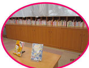
子育て支援コーナー

子育て支援コーナーは、児童資料コーナーのよみきかせ室内にあります。妊娠、出産、育児、子どもの病気、祖父母・お父さんの子育て、布おもちゃ・布絵本の作り方などの図書を中心に約450冊を集めています。