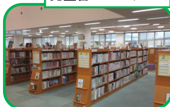
児童書のコーナー

絵本のコーナーでは、子育てに関するテーマの展示も行っています。取材時のテーマは、「楽しく会得したい熟睡ワザ」でした！