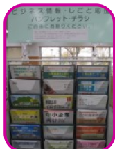
パンフレットコーナー

1947年5月3日(日本国憲法施行日)から直近までの官報の内容が検索・閲覧できます。